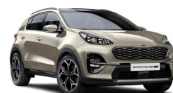
Canyon Silver (C2S)