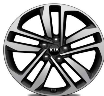
Cerchi in lega 19" 245/45R19