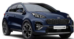
Cosmo Blue (CB7)