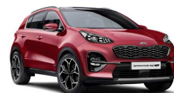
Infra Red (AA9)