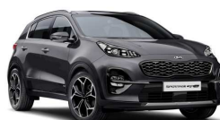
Penta Metal (H8G)