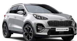
Sparkling Silver (KCS)