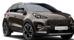
Copper Stone (L2B)