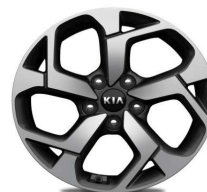
Cerchi in lega 17" 225/60R17