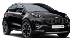
Pearl Black (1K)