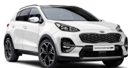
Deluxe White (HW2)