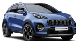
Blue Frame (B3L)