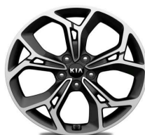
Cerchi in lega 19" GT Line 245/45R19