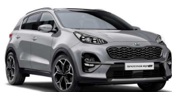
Lunar Silver (CSS)