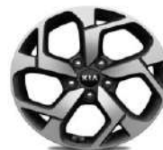
Cerchi in lega 17" 225/60R17