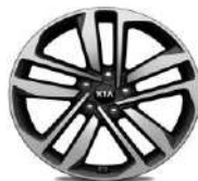
Cerchi in lega 19" 245/45R19