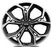
Cerchi in lega 19" GT Line 245/45R19